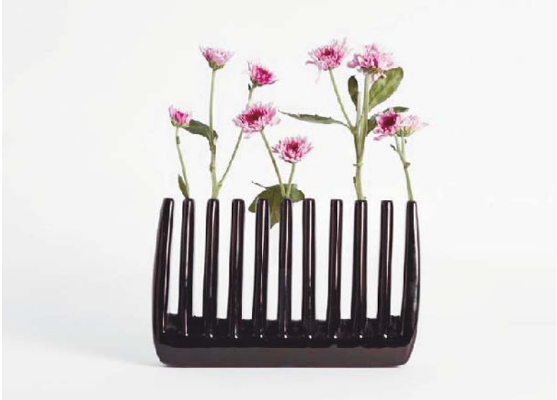
«Grattacapo» di Vito Nesta